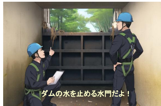
水門(扉体) 点検状況