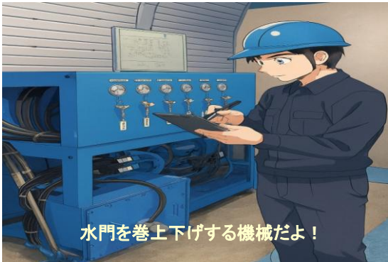
油圧装置 点検状況