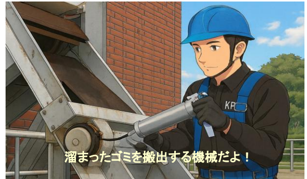
コンベア 点検状況