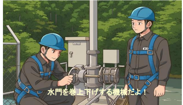
水門 巻上装置 点検状況