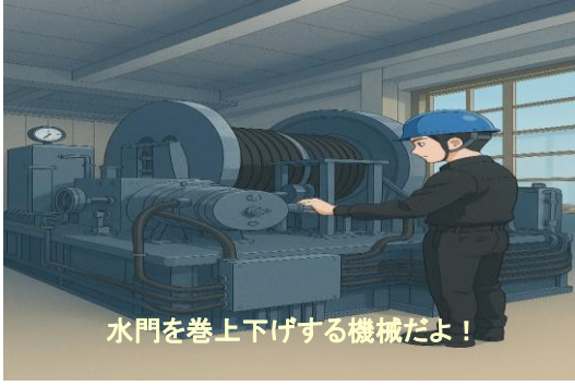
水門 巻上装置 点検状況

点検とは、利水・治水設備が正常に機能し安全が保たれるいるかを確認する保守活動で、故障や事故を未然に防ぎ、設備寿命を延ばす目的で実施しています。