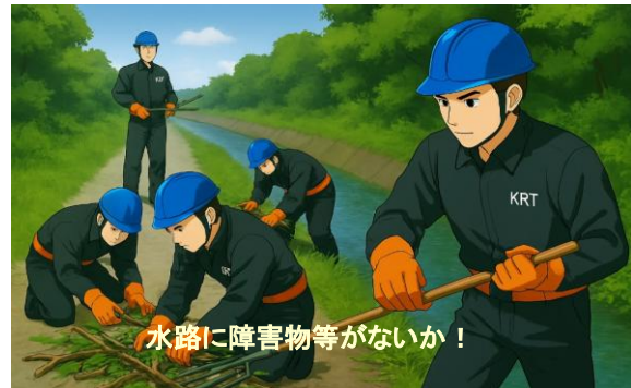
水路保守(巡視路整備)